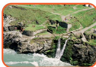
Cornwall - Tintagel