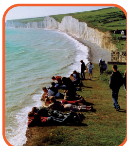
Eastbourne - křídové útesy