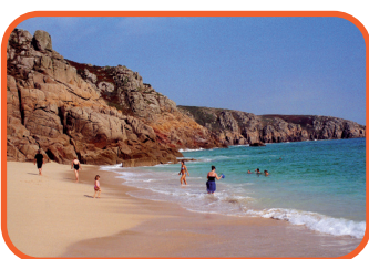
Cornwall - pláž u Porthcurno