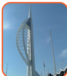
Portsmouth - Spinnaker Tower