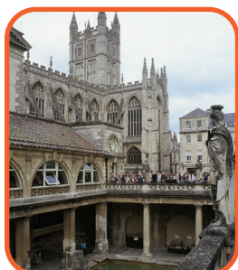
Bath - Římské lázně