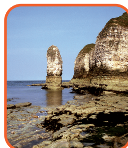
Sev. Anglie - Flamborough Head