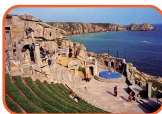
Cornwall - Minack Theatre