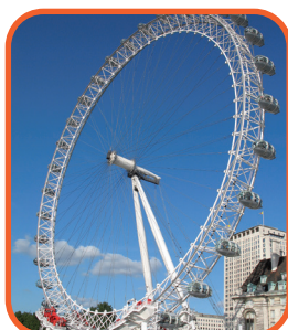
Londýn - London Eye